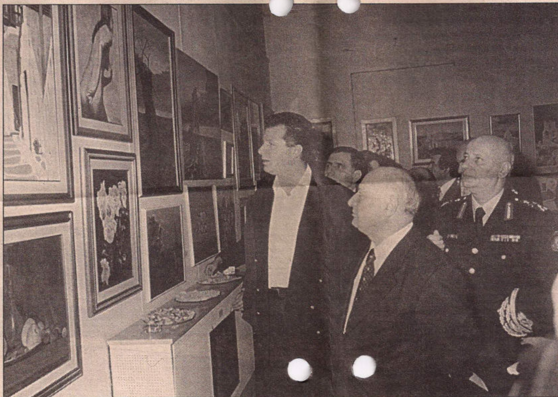
Ο υπουργός Δημόσιας Τάξης Γ. Ρωμαίος συνεχάρη τους καλλιτέχνες αστυνομικούς

Ο υπουργός συνεχάρη τους αστυνομικούς, τόνισε ότι το υπουργείο στήριζει την πρωτοβουλία τους και επισήμανε ότι η πολιτιστική παρέμβαση θα συνεχιστεί με μουσικά συγκροτήματα της ΕΛ.ΑΣ., που θα παίζουν μουσική στις πλατείες.