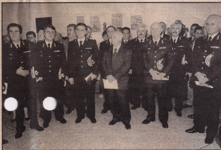
Ο υπουργός Δημοσίας Τάξης κ. Γ. Ρωμαίος, με την ηγεσία της ΕΛ.ΑΣ.

Ο κ. Ρωμαίος είδε ένα προς ένα τα εκθέματα και συνομίλησε με τους δημιουργούς, ενώ ζήτησε από την ηγεσία της ΕΛ.ΑΣ., κάποια απ' αυτά τα έργα να κοσμήσουν της Διευθύνσεις