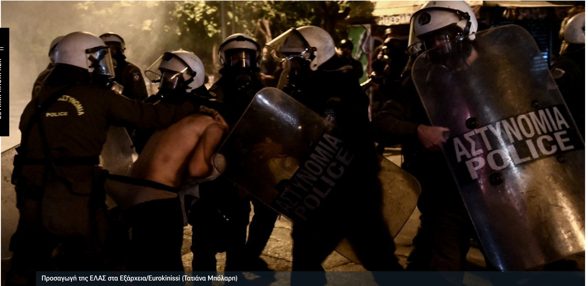
Προσαγωγή της ΕΛΑΣ στα Εξάρχεια