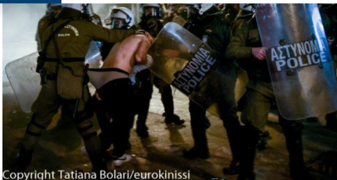
Προσαγωγή στα Εξάρχεια